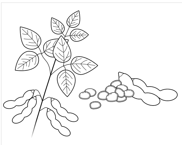
Abbildung 1 Sojapflanze

Die Sojabohne ist eine einjährige Pflanze, die eine Höhe von 80 – 100 cm erreicht. Nach einer Aussaat im Frühjahr beträgt die Vegetationszeit ca. 150 – 180 Tage, so dass im September/Oktober die Ernte erfolgen kann. Die Blütezeit der Pflanze beträgt nur 3 – 4 Tage, die Hülsen (Abbildung 2) werden 3 – 6 cm groß und enthalten jeweils 2 – 4 Samen. Die Bohnen in der Hülse beginnen zu reifen, wenn die Blätter der Sojabohne braun werden.