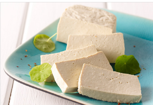
Abbildung 4 Tofu ist frei von tierischem Fett und enthält hochwertige pflanzliche Eiweiße und mehrfach ungesättigte Fettsäuren

Die Sojabohne ist eine sehr nährstoffreiche Pflanze. Sie besitzt einen großen Anteil an Eiweißen (38%). Hier sind die acht essenziellen Aminosäuren (Isoleucin, Leucin, Lysin, Methionin, Phenylalanin, Threonin, Tryptophan, Valin) enthalten, die für den körpereigenen Eiweißaufbau unentbehrlich sind. Des Weiteren besteht die Sojabohne aus 15%