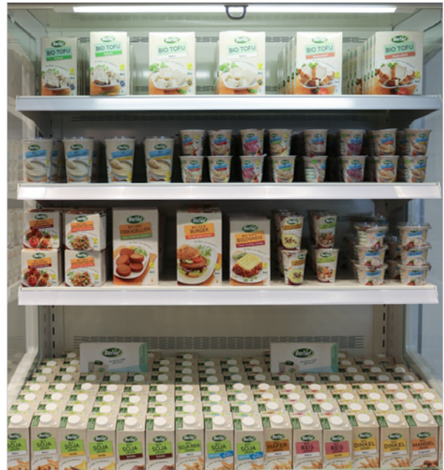
Abbildung 3 Verschiedene Produkte aus Sojabohnen

löslichen Kohlenhydraten (Saccharose, Stachyose, Raffinose), 18% Öl, 14% Feuchtigkeit und Asche, 15% Ballaststoffen. Sojabohnen werden bei der Berief Food GmbH zu verschiedenen Sojaprodukten verarbeitet, wie beispielsweise Getränken, Sojaghurt oder Tofu (Abbildung 3).