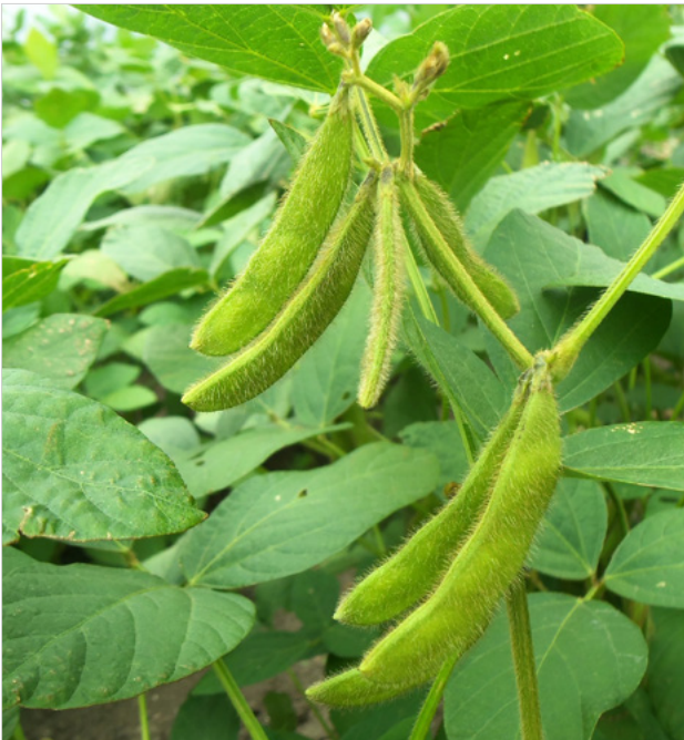
Abbildung 2 Hülse der Sojabohne

Der Anbau der Sojabohne erfolgt weltweit hauptsächlich in den USA, Brasilien, Argentinien, Indien und China. Die USA sind führend in der Sojaproduktion und ernten bis 90,6 Mio. Tonnen im Jahr. Weltweit liegen die Erntemengen für Sojabohnen bei 265 Mio. Tonnen jährlich.