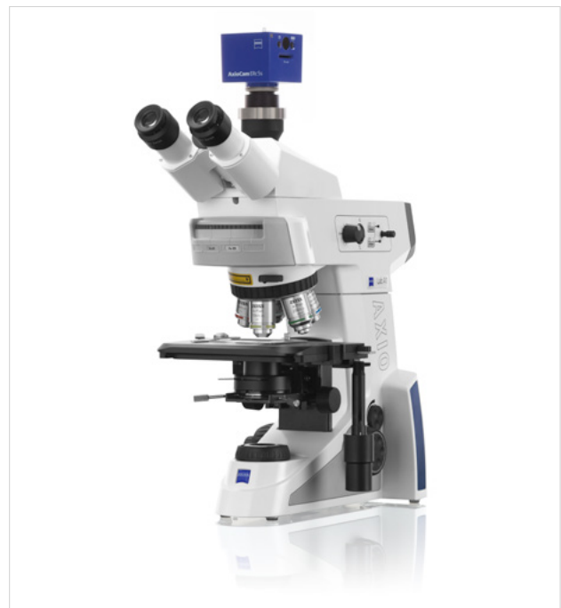
Abbildung 7 ZEISS Axio Lab.A1

wählen, die durch eine gute Dynamik und angepasste Auflösung auch Polarisationskontrastbilder sinnvoll darstellen kann.