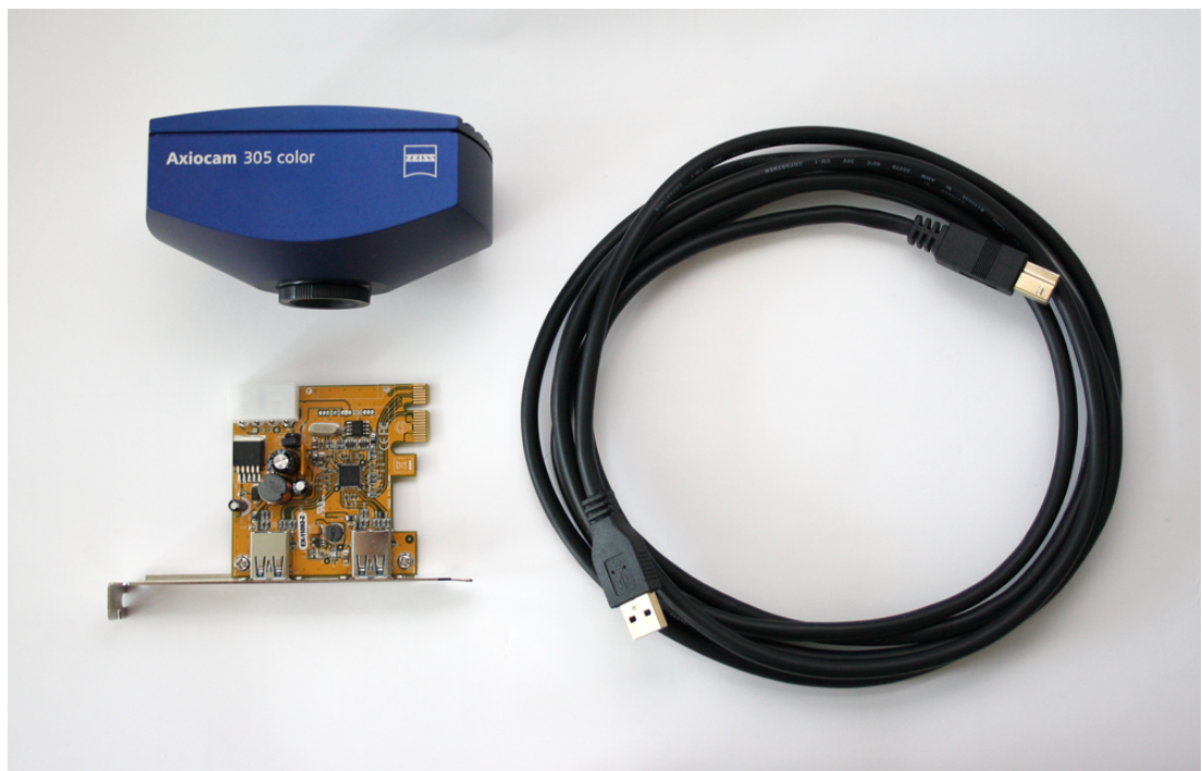
Abb. 1: Lieferumfang Axiocam 305 color