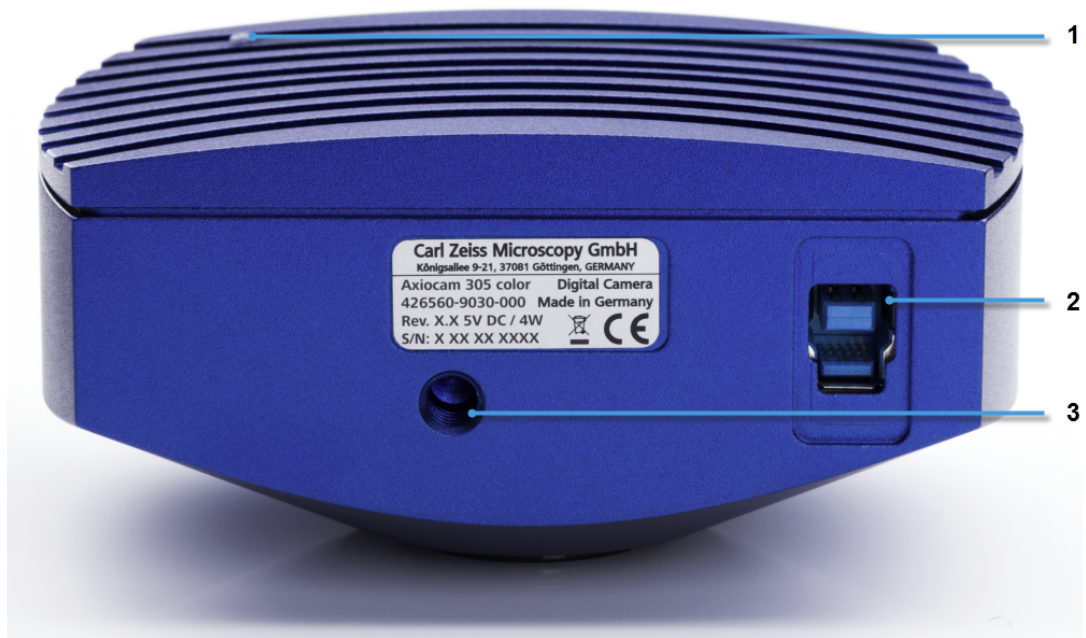
Abb. 2: Kamera (Rückseite)