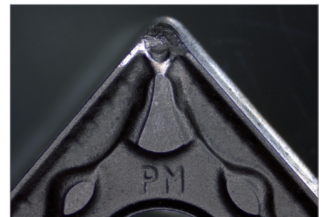
Wendeschneidplatte mit Zeichen von Werkzeugverschleiß. Auflicht, Ringlicht, Zoom 1,0x