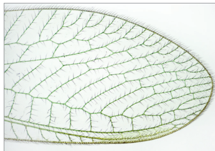
Florfliege Durchlicht – Hellfeld